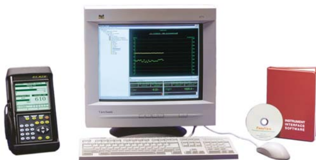
Le logiciel PanaView relie votre débitmètre TransPort à votre PC.

L'adaptateur infrarouge se branche sur tout port série disponible pour donner aux PC la fonctionnalité infrarouge.