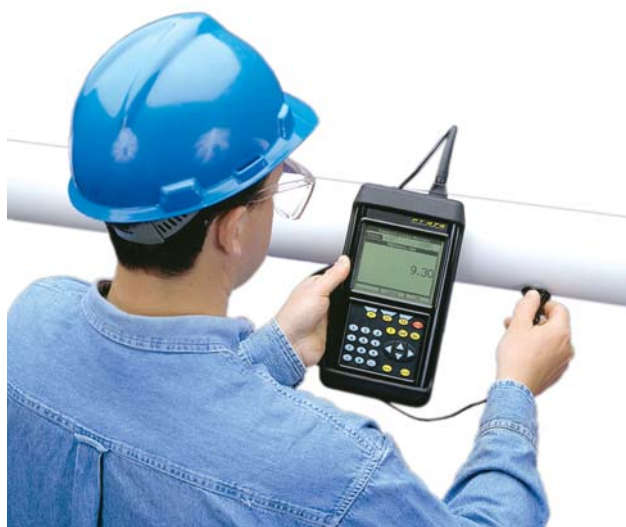
Calibre d'épaisseur PT878 en option

Fonctionnement continu jusqu'à 100 °F (37 °C) ; fonctionnement intermittent jusqu'à 500 °F (260 °C) pendant 10 s, suivi d'un refroidissement à l'air pendant 2 minutes