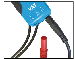
cordons pointes de touche détachables