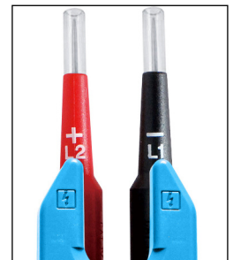
Pointes de touche IP2X (2mm et 4mm)