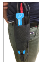
SC523 Etui ceinture