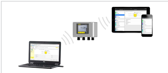
Connexion sans fil au smartphone/à la tablette/à l'ordinateur portable

Le paramétrage est effectué au moyen d'une application gratuite disponible dans " Apple App Store", " Google Play Store" ou " Baidu Store". En alternative, il est possible de procéder au paramétrage aussi via PACTware/DTM et un PC Windows.