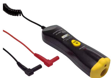
Sonde tachymétrique sans contact CA 1711 pour les mesures de vitesse de rotation (de 6 à 120 000 RPM)