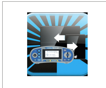
A1431 : Licence EuroLink Android®