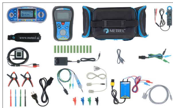
Un jeu d'accessoires complets livré en standard