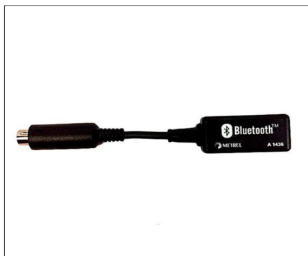
A1436 : Dongle Bluetooth pour communication entre les appareils