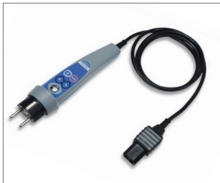
A1314 : Sonde active 2P+T