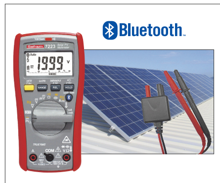
Sefram 7223 + SA163 : Complétez votre ensemble de test avec un multimètre communiquant dédié au photovoltaïque.