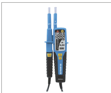
Sefram 66 : VAT / DDT jusqu'à 1000 V AC et 1500 V DC