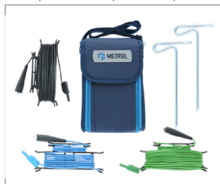
S2026 : Kit de mesure de terre avec piquets