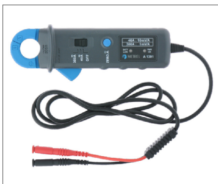
A1391 : Pince AC/DC 300A