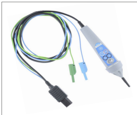
A1401 : Sonde active type pointe de touche